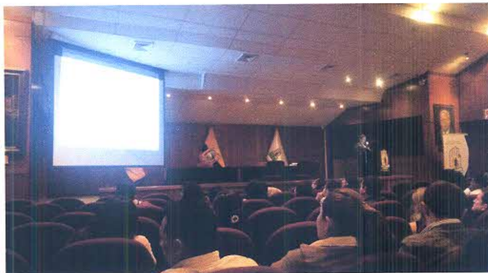
Fotografía: Desarrollo de Capacitación USHAY

La capacitación fue productiva se dio algunos consejos, se atendió algunas preguntas y se compartió experiencias del mismo en las temáticas propuestas.