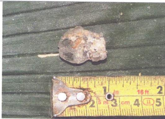
U31, Ampl. 1, D2, R9, cuarzo