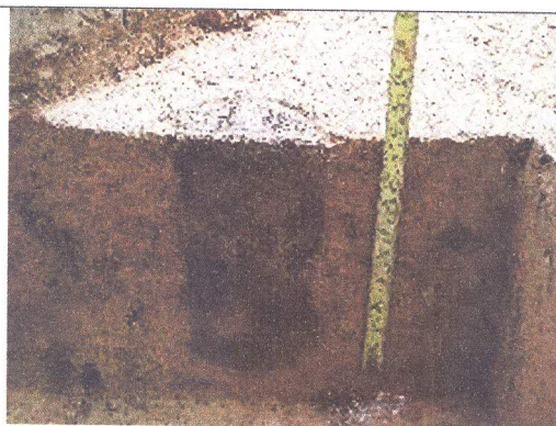
U31, Ampl. 1, D3, R6, E6