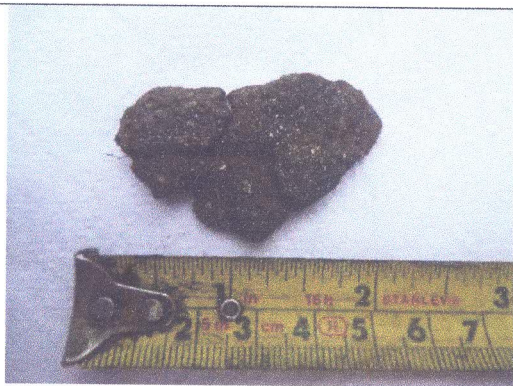
U31, Ampl. 1, D2, R9, frag. cerámico