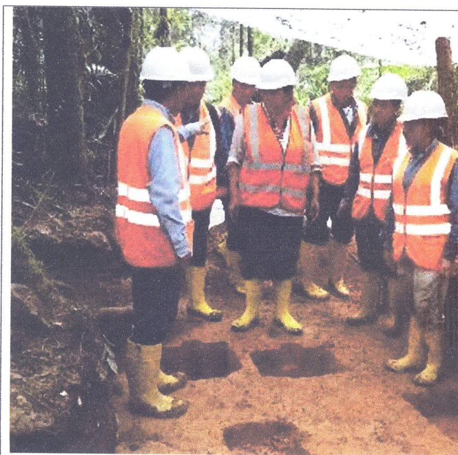
U31, Ampl. 1, D3, moldes de poste