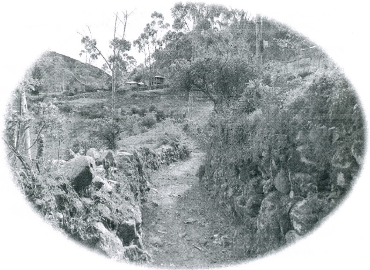
Inicio del Qhapaq Ñan Subtramo Achupallas Ingapirca