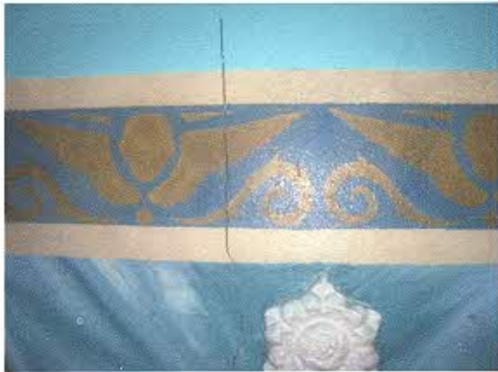
FOTOGRAFIA NRO. 3: Presencia de fisuras en pared de nave de la iglesia.