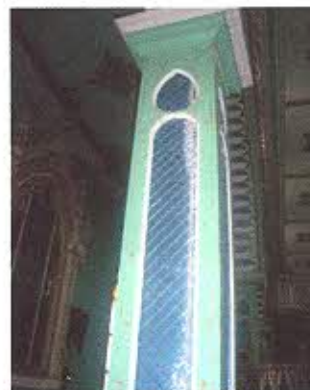
FOTOGRAFIA NRO. 2: Presencia de fisuras en revestimiento de madera de los pilares interiores de la iglesia.