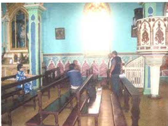
FOTOGRAFIA NRO. 1: Inspección conjunta con Técnico del GAD-Zaruma y comunidad