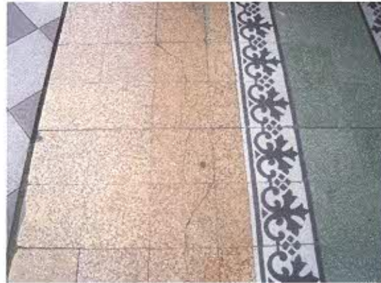
FOTOGRAFIA NRO. 6: Presencia de fisuras longitudinales y transversales en nave de la iglesia.