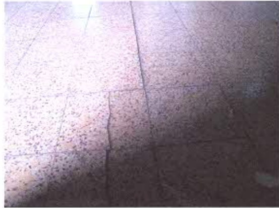
FOTOGRAFIA NRO. 4: Presencia de fisuras longitudinales y transversales en nave de la iglesia.