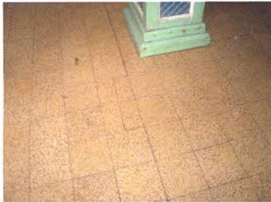
FOTOGRAFIA NRO. 5: Presencia de fisuras longitudinales y transversales en nave de la iglesia.