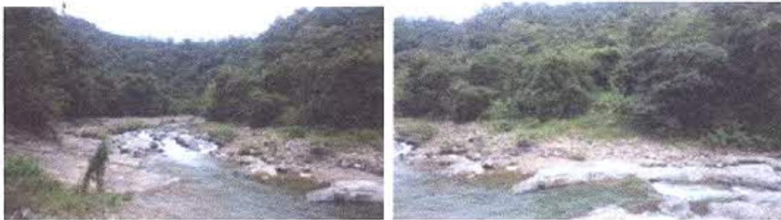
Figura 3-4 - Vista general del área minera GPL COCHURCO 3