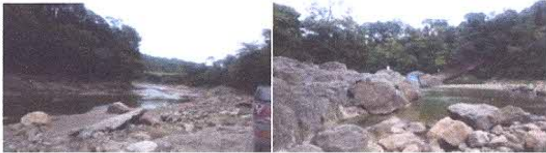
Figura 1-2 - Vista general del área minera GPL COCHURCO 1

paleontológicos. Se visitaron las tres áreas mineras de libre aprovechamiento, para constatar su ubicación y evidenciar si a nivel superficial se observan elementos de importancia paleontológica o arqueológica.