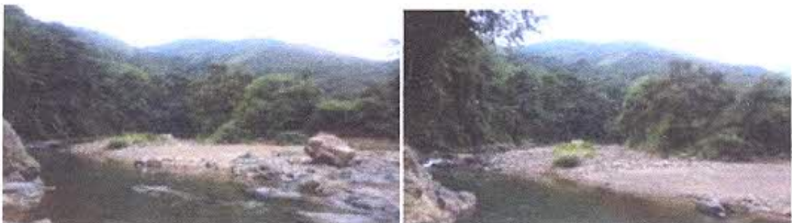
Figura 5-6 - Vista general del área minera GPL COCHURCO 2