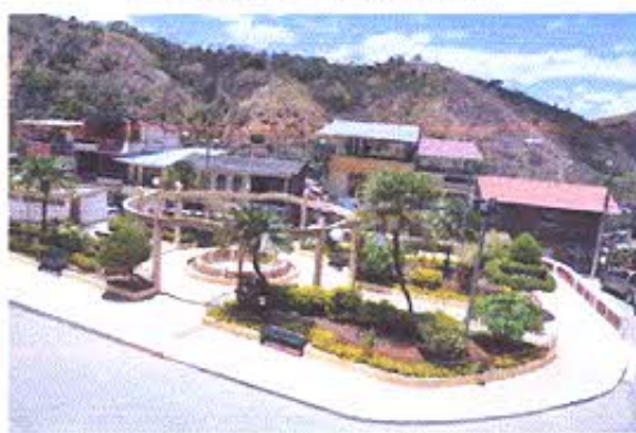
FOTOGRAFIA NRO. 4. IBI-07-02-50-000-000133 – Parque de Portovelo