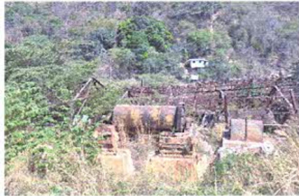
Fotografía nro. 4: Registro fotográfico de antigua área minera de la SADCO