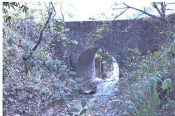
Fotografía nro. 6: Registro fotográfico de puente antiguo