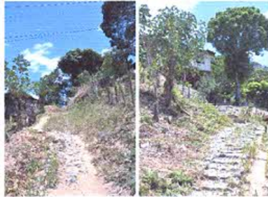
Fotografía nro. 2: Registro fotográfico de caminos antiguos