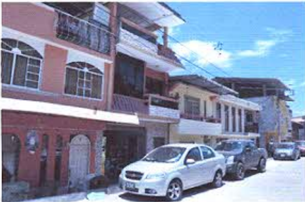
Fotografía nro. 3: Registro fotográfico de edificaciones patrimoniales.