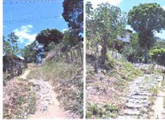
Fotografía nro. 2: Registro fotográfico de caminos antiguos