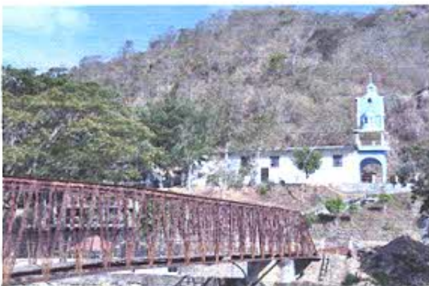
Fotografía nro. 5: Registro fotográfico de puente antiguo