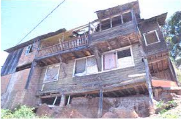
Fotografía nro. 1: Registro fotográfico de edificaciones patrimoniales.