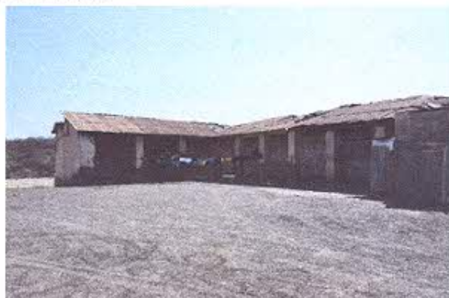
Figura 1.- Inmueble de la escuela José Antonio Campos.

A partir de las 15:00 nos dirigimos hacia las instalaciones del GAD municipal de Zapotillo, en donde nos pusimos en contacto con los técnicos responsables del área de planificación, quienes fueron delegados para realizar junto al equipo técnico del INPC, la inspección del bien inmueble de la escuela José Antonio Campos. Durante la inspección pude colaborar en el registro fotográfico del bien inmueble, y de igual forma aporté con algunos criterios de patrimonio cultural inmaterial que se pueden agregar al proyecto de restauración de este bien inmueble, puesto que se plantea construir un centro cultural binacional, en el cual se hace necesario espacios informativos-educativos sobre: tradición oral, memoria histórica, gastronomía, técnicas de construcción ancestrales entre otras.