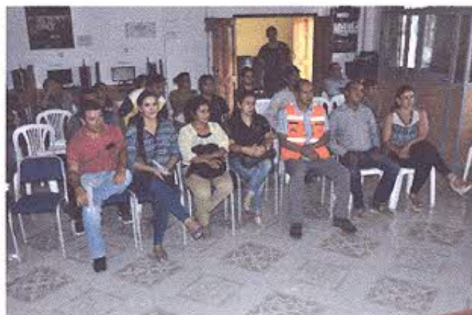
Figura 3.- Reunión de socialización en la parroquia Bolaspamba.

A partir de las 15:00 se participó de la segunda reunión, la cual se desarrolló en la parroquia Bolaspamba; la metodología de trabajo para esta reunión se modificó, pues se realizó una socialización de los acuerdos que se alcanzaron entre las instituciones, en la reunión de la mañana en Cazaderos; sin embargo se recogió las sugerencias de los pobladores de Bolaspamba.