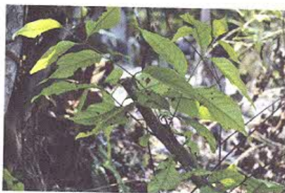
Figura 4.- Hoja de ayawaska o natém, usada para diferentes rituales en la cultura Shuar.

A las 12:15 procedimos a regresar a la ciudad de Loja, llegando a las 17:30.