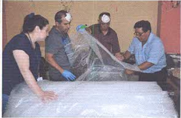
FOTOS 1 Y 2.- Técnicos en las labores de embalaje.