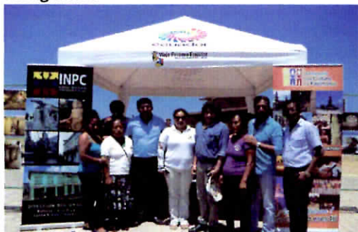
Delegados de las instituciones y artesanas