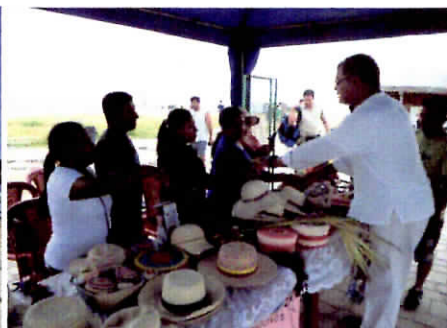
Presidente Correa saluda a las artesanas