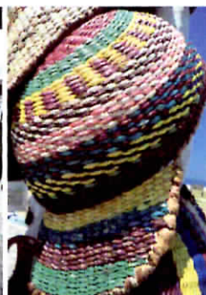
Gorra de toquilla pintada