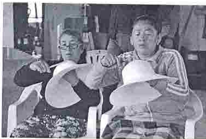
Tejedoras de sombrero de paja toquilla

Guayaquil Orellana No. 200 y Panamá, esquina. Edificio Panamá 1er. Piso alto Ofic. 102 Telef: (5934) 2303671/ 2568 247