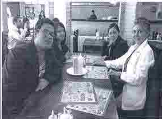
según captación de 26.04.2017.