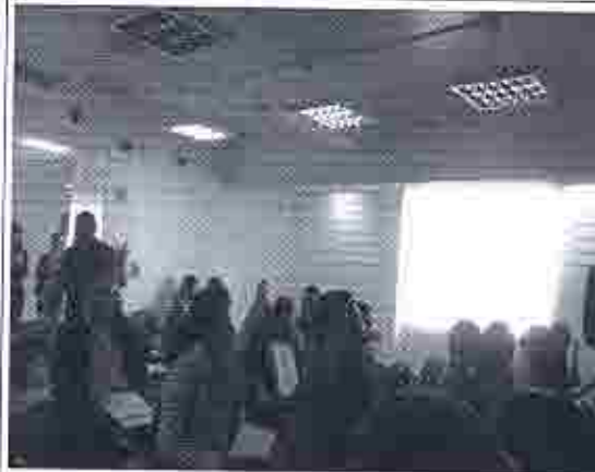
IMAGEN 04.- Vista de participantes (Extremo B del Salón) en el curso el segundo día, provenientes de las Regionales del INPC, Matriz y peritos acreditados. 12H00 PM