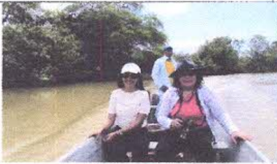
Fotografía Nro. 5: Recorrido en lancha por el río Santa Rosa.