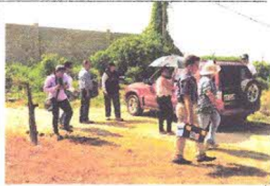
Fotografía Nro. 2: Sector El arenal