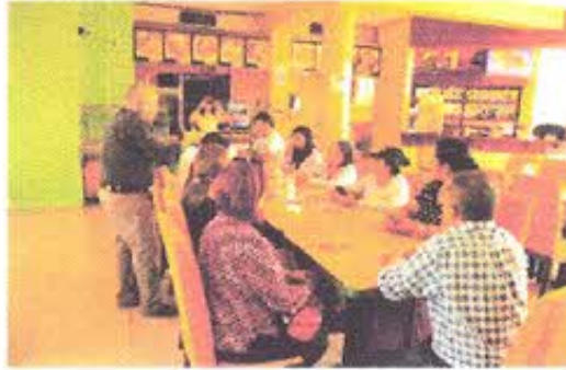
Fotografía Nro. 1: Reunión con Miembros de APROCAM