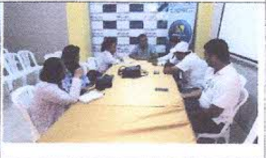
Fotografía Nro. 8: Reunión con Miembros de APROCAM para establecer hoja de Ruta