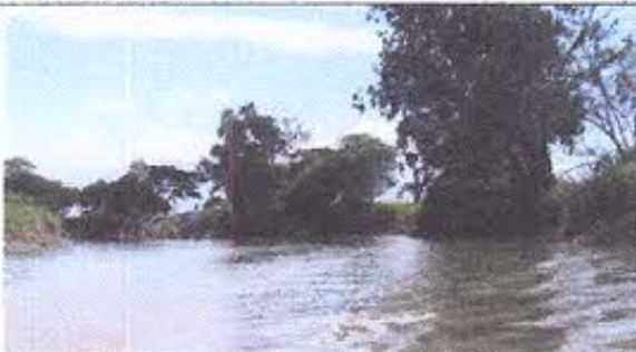
Fotografía Nro. 7: Vista de orillas de terrenos de la Emergencia