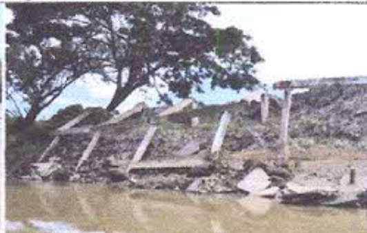
Fotografía Nro. 6: Vista de terrenos de la Emergencia