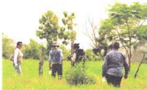
Fotografía Nro. 3: Recorrido de antiguo camino