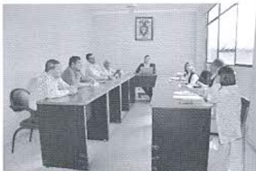
Fotografía nro. 1: Reunión con concejales del GADM-Zapotillo.