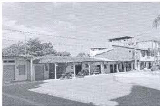
Fotografía nro. 3: Inmuebles patrimoniales inventariados-Zapotillo.