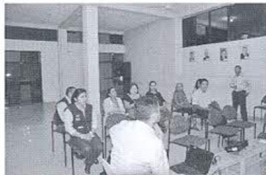
Fotografía nro. 2: Reunión con concejales, técnicos del GADM-Zapotillo y propietarios de los bienes inmuebles inventariados.