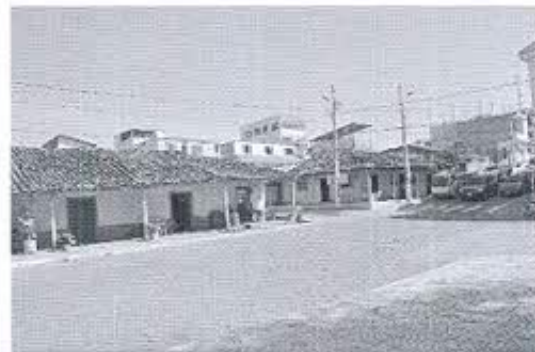
Fotografía nro. 4: Inmuebles patrimoniales inventariados-Zapotillo.