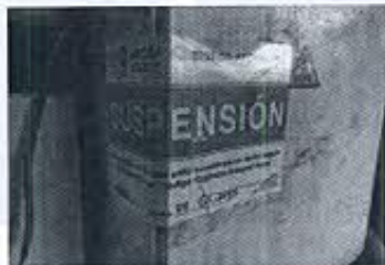
Fotografía N° 2, 3.- Bocamina y sello de cierre colocado allí por ARCOM.