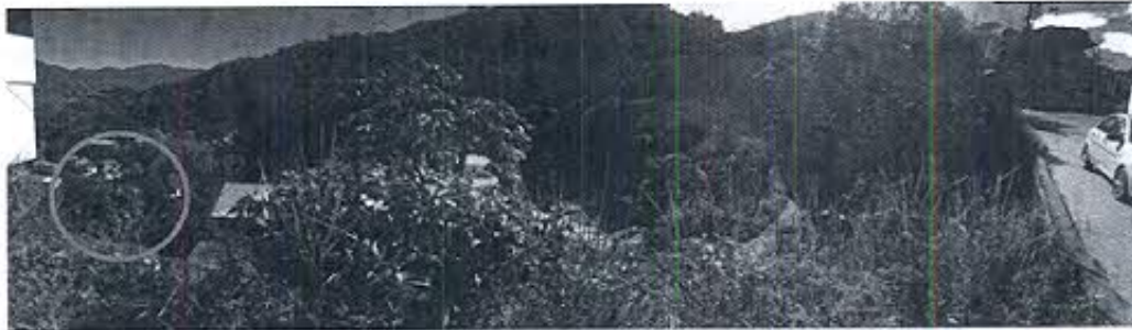
Fotografía N° 1.- Ubicación de las instalaciones de la minera MINECSA y de parte del área concesionada a ellos.

A decir del representante de la empresa minera MINECSA, si se parte del punto en donde se ubican sus instalaciones, las actividades extractivas que ejecutan estarían orientadas hacia el norte de ese punto, es decir se desarrollarían para el lado contrario de la parte consolidada de la ciudad de Zaruma y su Centro Histórico.