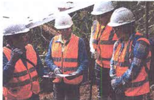
Foto 6.- Personal del INPC R7 revisando los registros de campo.