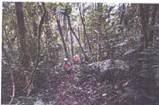
Foto 4.- Camino de acceso hacia el AIA 13, en el sector del Higuerón.

Se realizó la inspección al rescate arqueológico del AIA 13 del replanteamiento (2018) de la vía Pindal (sector el Higuerón) coordenada de referencia 771163 9584788 abscisa 13+585, donde se han excavado 20 unidades, estas contienen material cultural cerámico y lítico importante.