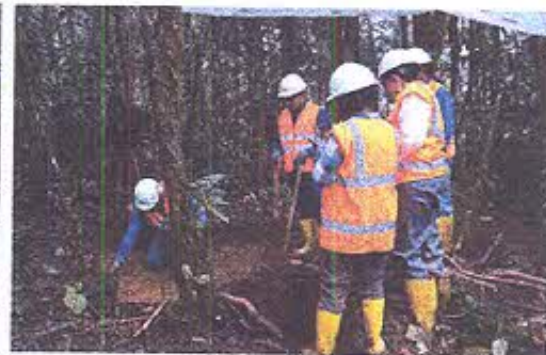
Foto 5.- Vista del área en donde se realizan las labores de excavación de rescate.