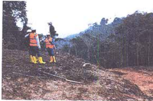
Foto 3.- Personal del INPC R7 en el área de monitoreo de la vía Pindal-Machinaza

Se inspeccionó también el área de monitoreo arqueológico en el replanteamiento de la vía Pindal Machinaza, coordenada E 769201 N9583597.