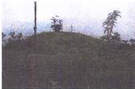
Foto 1.- Vista del área V10 de la línea de transmisión