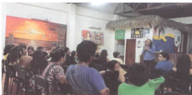
Dirigiendo el foro en CIC Manglaralto.