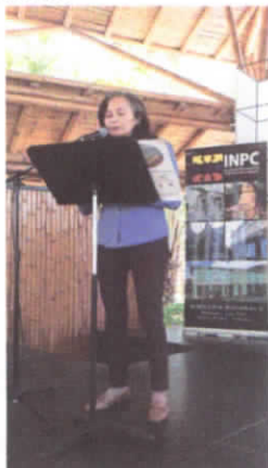
Conferencia en Museo Amantes de Sumpa