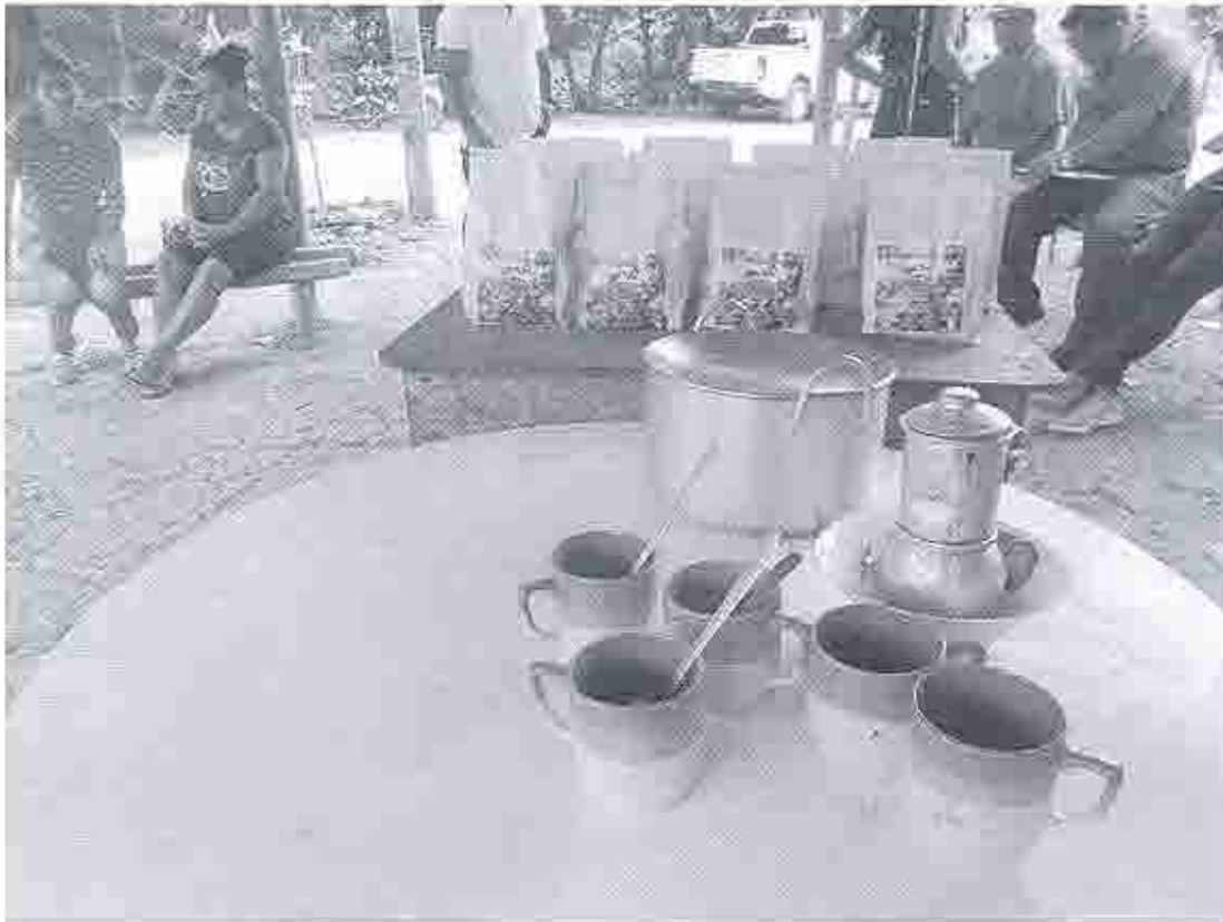
Degustación de Café de la Asociación Icono Verde.