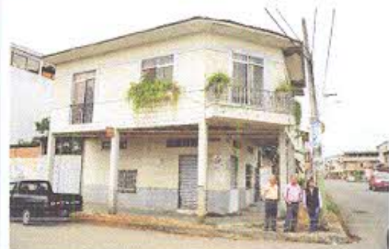
Fotografía nro. 4: Recorrido por los Bienes inmuebles patrimoniales registrados en la ciudad de Pasaje.