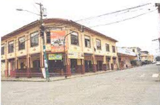
Fotografía nro. 3: Inmuebles patrimoniales registrados-Pasaje.