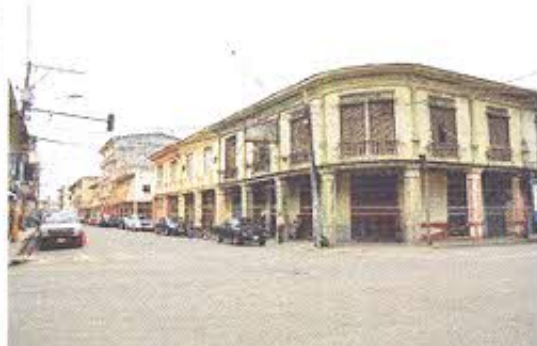
Fotografía nro. 2: Recorrido de campo en la ciudad de Pasaje.