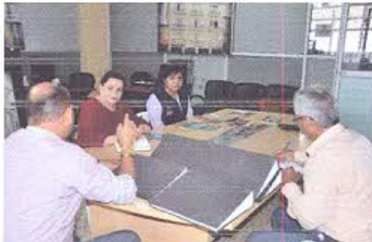
Fotografía nro. 1: Reunión con Técnicos del Departamento del Patrimonio Arquitectónico y Cultura del GADM-Pasaje.