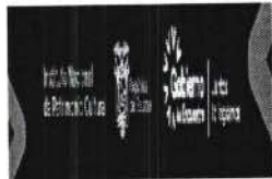
logo ook.png 7 KB