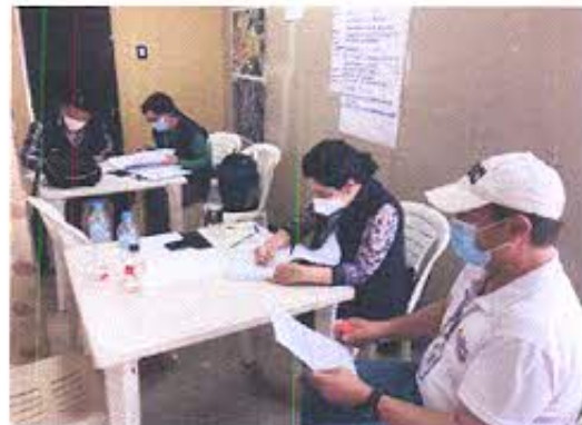
Fotografía nro. 2: Personal técnico INPC en Mesa Técnica de Trabajo 7.