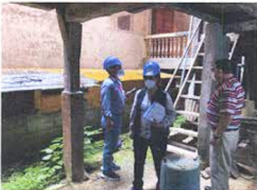
Fotografía nro. 1: Grupo 3 en inspecciones de inmuebles patrimoniales en Zaruma.