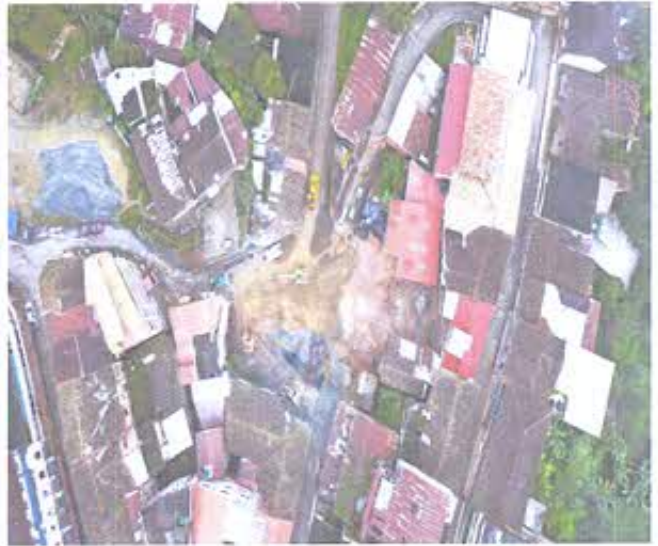
Fotografía N°2: Toma de Imagen aérea con drone mavic 2.