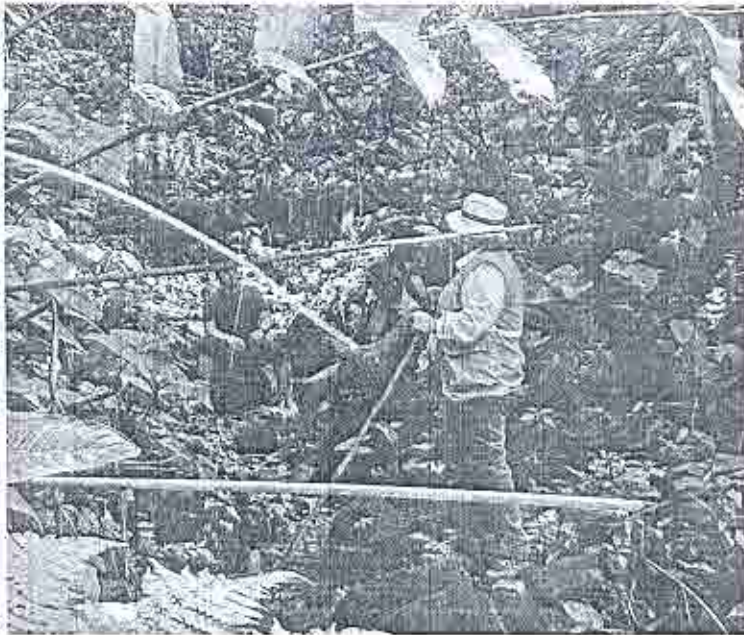
Equipo Técnico del INPC DTZ 4, en el Sitio Koleka Napi via a Puerto Limon 25-02-2022