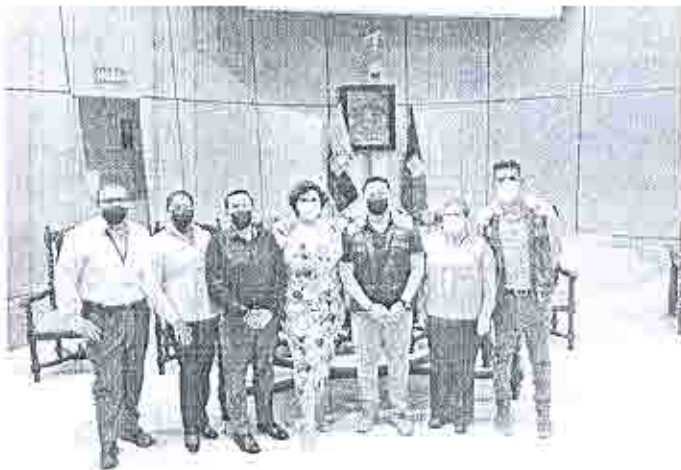
Autoridades y funcionarios GAD Santo Domingo Capacitación 24-02-2022

Recomendación: Completar proceso de levantamiento de Ficha en Asociación Chachi, conversar con Representantes de Comuna Chigüilpe, para conocer la buena vecindad y facilitación de aprovechamiento de recursos naturales como la flora del Bosque específicamente la Toquilla para la elaboración de artesanías Chachis y conocer la posibilidad de la continuidad de la manifestación y/o su vulnerabilidad en la transmisión en este territorio. Comunicaron de la Falta de inclusión en la declaratoria de la Marimba, ancestralmente elaborada y utilizada por el pueblo Chachi, que compartieron sus conocimientos con el pueblo Afro a su llegada en la Colonia, y al ser un instrumento que se socializó se apropió y difundió por los afro descendiente, tema que no se indagó pero que dejaron sentado se incluya en la declaratoria de la Marimba realizando estudios más profundos, ya que se sienten ausentes, al igual que comentaron comparten esta manifestación del patrimonio sonoro con los Tsáchilas que al decir de ellos comparten además de la marimba, raíces lingüísticas que los identifican mutuamente.