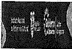
MANUAL_FIRMA_MAIL_ok.png 7 KB