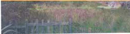
Fotografía N°5: Vista lateral, sitio Cueva Negra del Chobshi, en el cantón Sigüig.