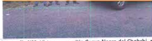
Fotografía N°6: Vista acceso, sitio Cueva Negra del Chobshi, en el cantón Sigüig.